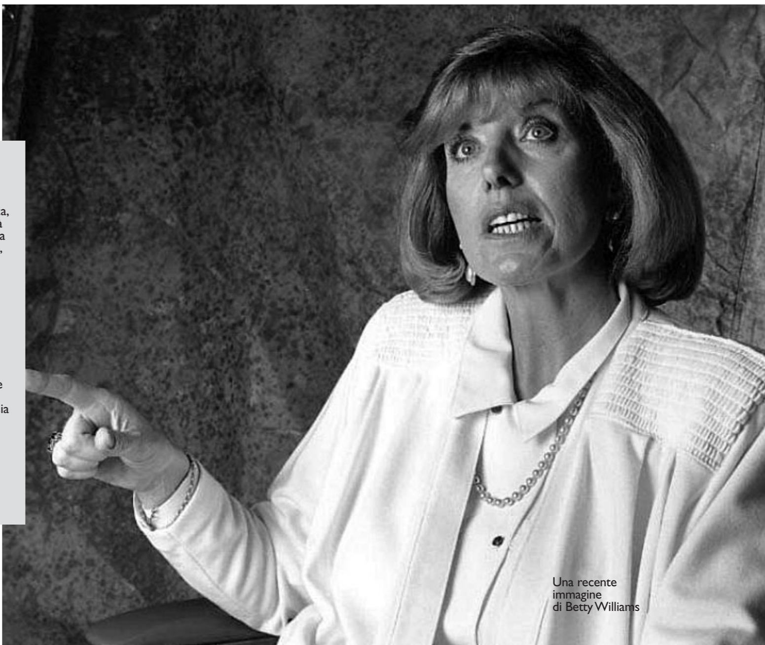
Una recente immagine di Betty Williams